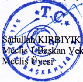
Sadullah KIRBIYIK Meclis Başkanı Vekili Meclis Üyesi

Gündemimizde görüşülecek herhangi bir konu kalmadığı cihetiyle, birleşimi kapatıyorum. (Birleşim kapatıldı). 06/05/2026-Çarşamba Saat: 10:40